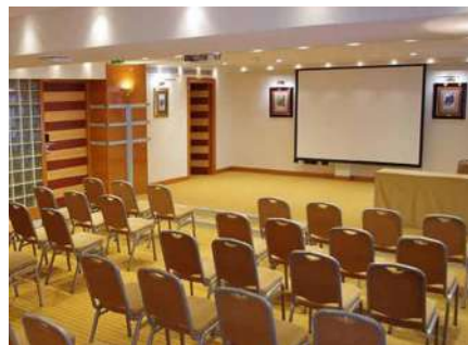
Sala za seminare – hotel Dubrovnik

Slično je s brojnim podvrstama kamatnih opcija i još raznovrsnijim egzotičnim opcijama, koje ćemo detaljnije razmatrati na radionici.