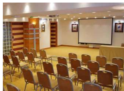
Sala za seminare – hotel Dubrovnik

Slično je s brojnim podvrstama kamatnih opcija i još raznovrsnijim egzotičnim opcijama, koje ćemo detaljnije razmatrati na radionici.