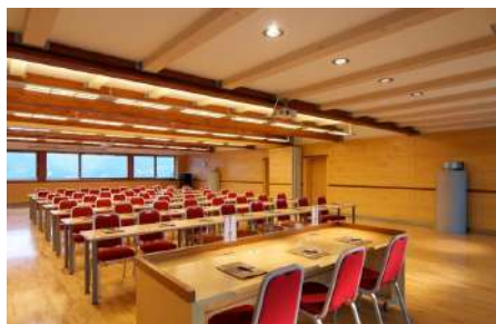
Večnamenska dvorana Panorama