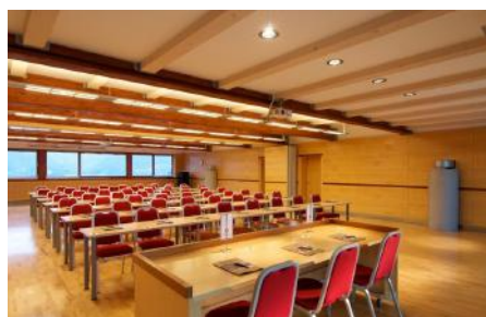
Večnamenska dvorana Panorama