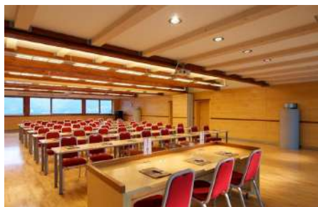
Večnamenska dvorana Panorama