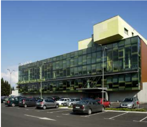
Kraj izvedbe: Ljubljana, Four Points by Sheraton Ljubljana Mons

* Življenjepis predavatelja najdete na spletni strani http://goo.gl/QCztRG