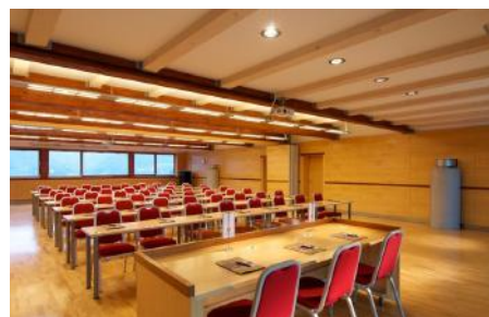
Večnamenska dvorana Panorama Hotel Lovce, Bled

Podobno je s številnimi podvrstami obrestnih opcij in še bolj raznovrstnimi eksotičnimi opcijami, ki jih bomo podrobno obravnavali na delavnici.