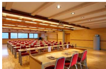
Večnamenska dvorana Panorama Hotel Lovce, Bled

Podobno je s številnimi podvrstami obrestnih opcij in še bolj raznovrstnimi eksotičnimi opcijami, ki jih bomo podrobno obravnavali na delavnici.