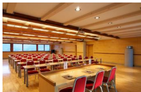
Večnamenska dvorana Panorama Hotel Lovec, Bled

Trenutna finančna kriza bo verjetno očistila tudi ta segment finančnega trga. Pričakovati je zmanjšanje kompleksnosti in netransparentnosti pri trgovanju ter povečanje kompleksnosti pri spremljanju in upravljanju tveganj.