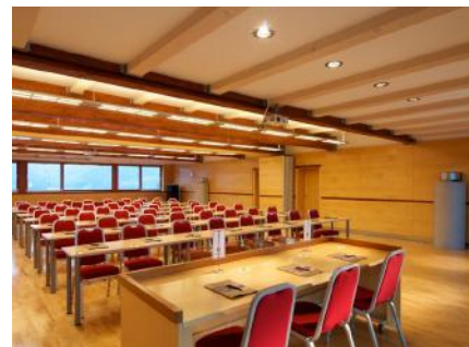
Večnamenska dvorana Panorama

Večja kot je uporaba dolga glede na kapital za financiranje poslovanja podjetja večje je tveganje, povezano z višino prihodkov. To tveganje nosijo lastniki družbe.