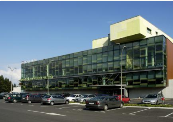
Kraj izvedbe: Ljubljana, Four Points by Sheraton Ljubljana Mons

* Življenjepis predavatelja najdete na spletni strani http://goo.gl/QCztRG