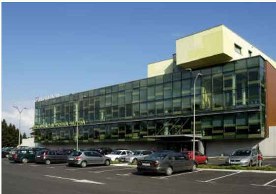
Kraj izvedbe: Ljubljana, Four Points by Sheraton Ljubljana Mons

* Življenjepis predavatelja najdete na spletni strani http://goo.gl/QCzRG