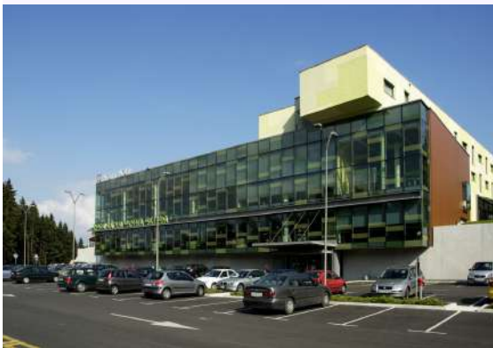
Kraj izvedbe: Ljubljana, Four Points by Sheraton Ljubljana Mons

* Življenjepis predavatelja najdete na spletni strani http://goo.gl/QCztRG