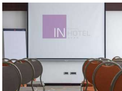
Seminarska sala – In Hotel, Bul. Arsenija Černojevića 56, Novi Beograd

Planiranje i izvođenje uspešne strategije zaštite portfelja obveznica obuhvata: