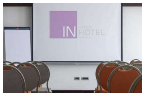
Seminarska sala – IN hotel, Bul. Arsenija Čarnojevića 56, Novi Beograd

Likvidnost je sposobnost organizacija da finansiraju povećanje sredstava i ispunjuju dospеле obaveze. Osnovna uloga banaka u transformaciji ročnosti kratkoročnih depozita u dugoročne kredite automatski izlaže banke likvidnosnom riziku. Čak bi se moglo reći da gotovo svaka finansijska transakcija ima uticaj na likvidnost. Tržišni potresi, koji su počeli da se događaju sredinom 2007. godine, ponovo su naglasili značaj likvidnosti za funkcionisanje finansijskih trgova i bankarskog sektora.